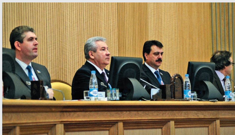
Все вопросы к этим ребятам