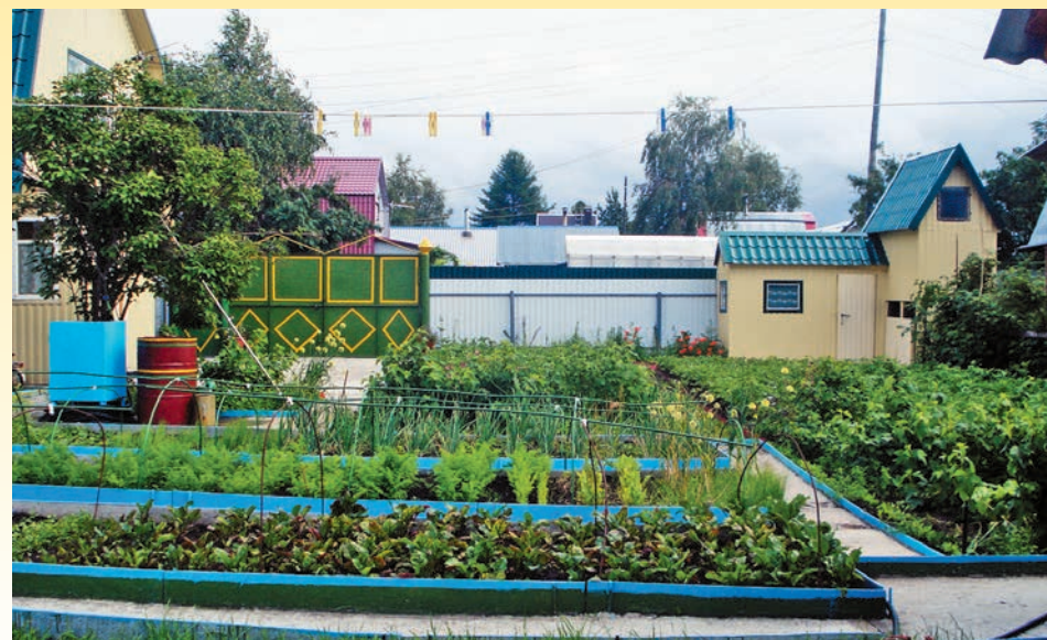
И такую красоту сносить? Собственными руками?