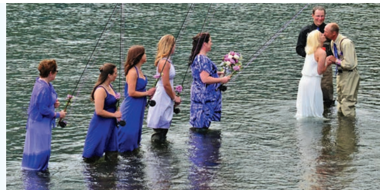
Рыбацкая свадьба на Аляске. Так утверждается северный образ жизни.

Нужно искать компромиссные варианты и у нас. Ведь аргументы нефтяных компаний не очень убедительны. Предположим, я покупаю по одной акции всех обществ, работающих на территории округа, становлюсь миноритарным акционером. Расходы, по сути, ничтожные – одна акция стоит недорого. Что теперь со мной делать? С юридической точки зрения я такой же совладелец дорог, скважин, как и все остальные акционеры. Имею право посмотреть, как идут дела на том или ином промысле,